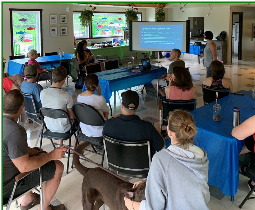
Formation et Présentation en Juillet 2019