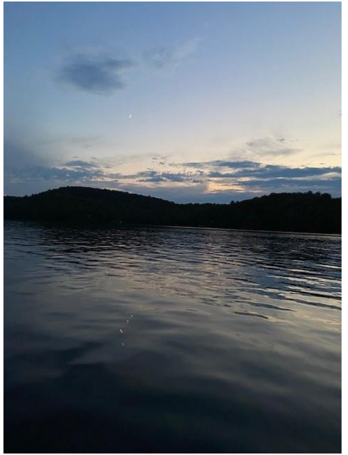
Une nuit relaxante sur Barkmere