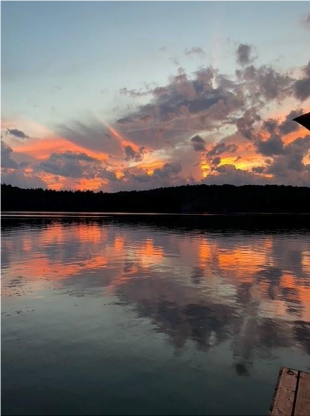
A beautiful sunset in Cope Bay

For more details, consult the minutes of the council meeting that will be posted on the town's website once they are ratified, generally at the next council meeting.