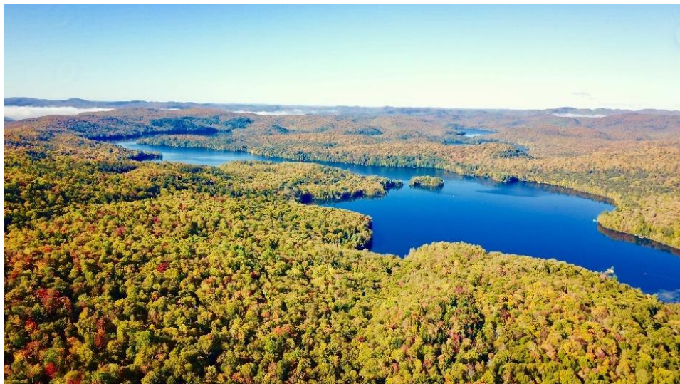
Le lac des écorces, automne 2025

Pour plus de détails, consultez le procès-verbal de la réunion du Conseil qui sera affiché sur le site Web de la Ville une fois qu'il sera ratifié, généralement quelques jours suivant la prochaine réunion du Conseil.